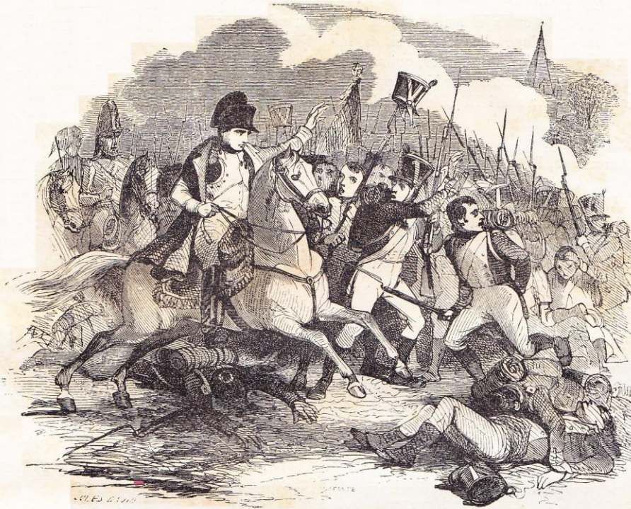
Conserits ! votre Empereur est avec vous ! Il attend tout de votre courage !

renaître et se multiplier devant ces masses ennemies toujours grossissantes.